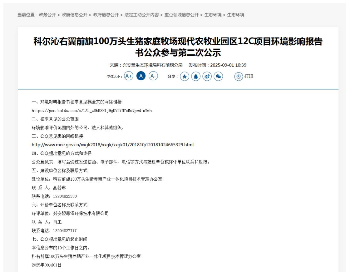
图 3.2-1 第二次公示网络截图