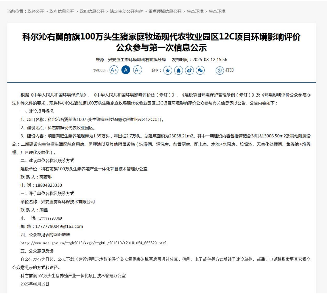
图 2.2-1 第一次公示网络截图