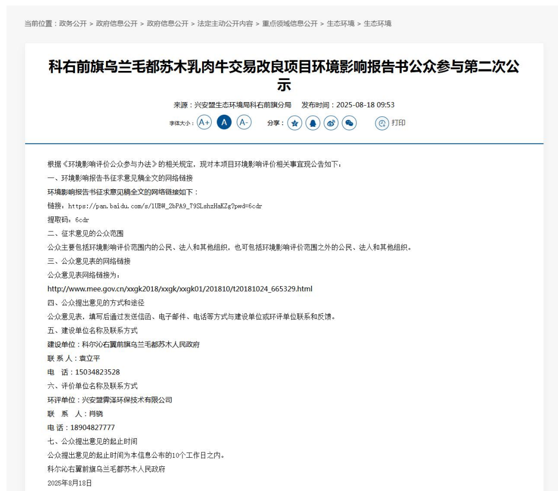
图 3.2-1 第二次公示网络截图