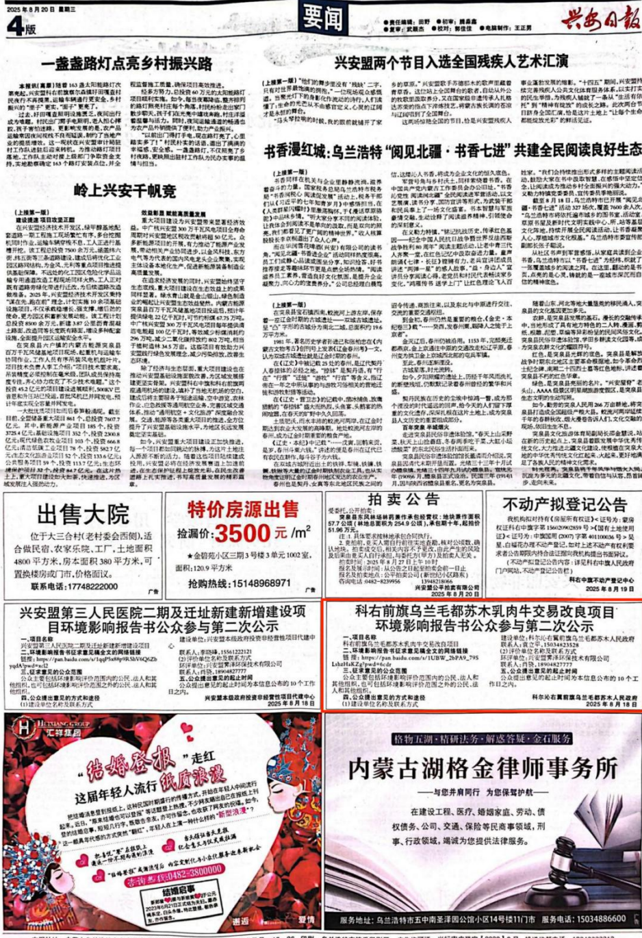
图 3.2-3 8.20 报纸公示截图