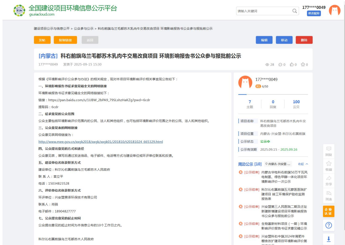
图 4-1 报批前公示截图