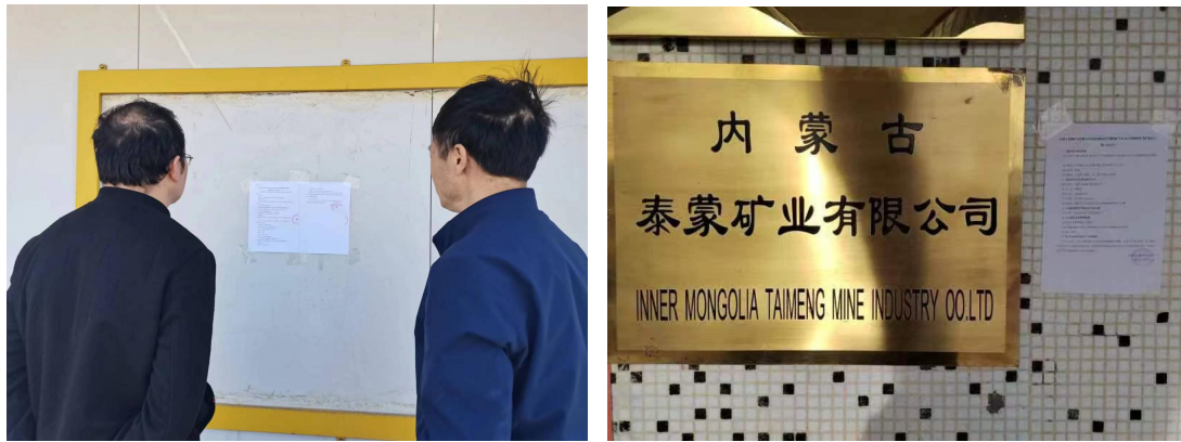
图 3-5 项目环评公众参与第二次公示现场