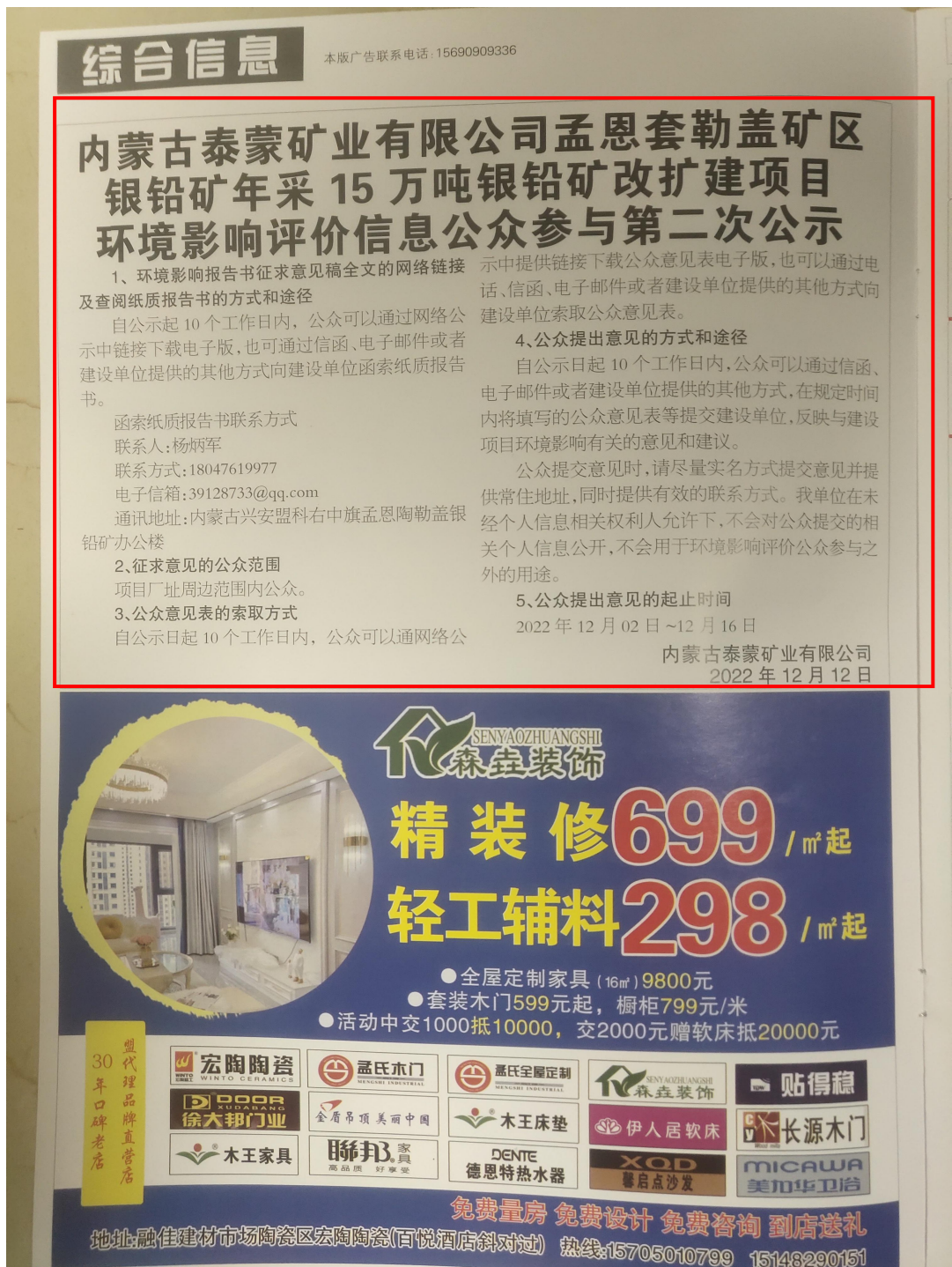
图 3-4 项目第二次报纸公示情况