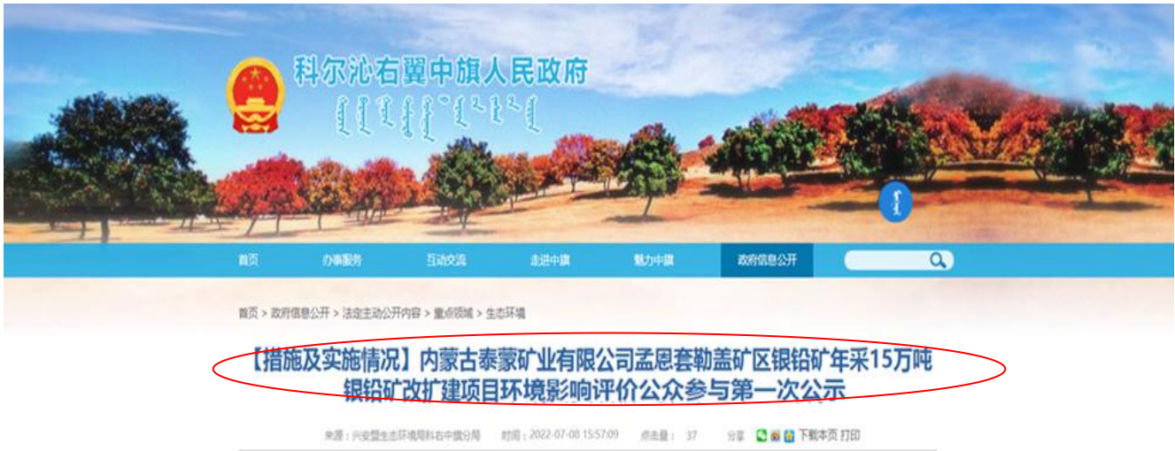
图 2-1 项目环评公众参与第一次网络公示截图