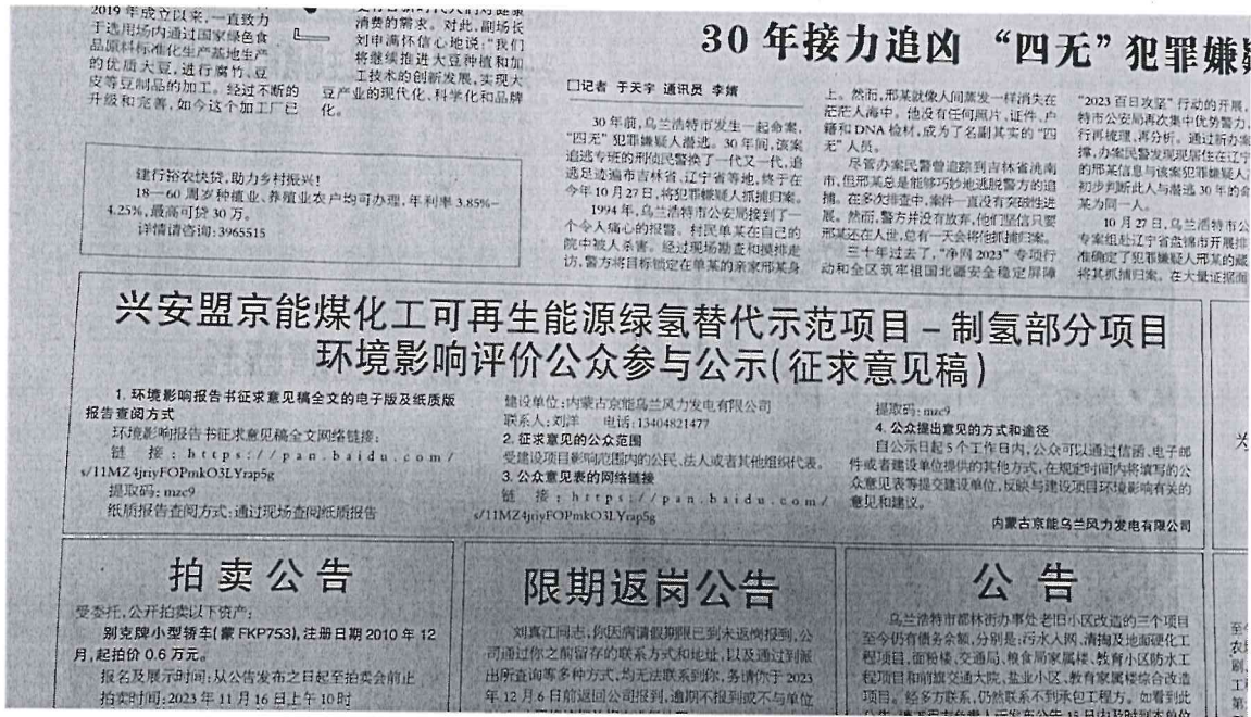
图 3 第二次报纸公示照片