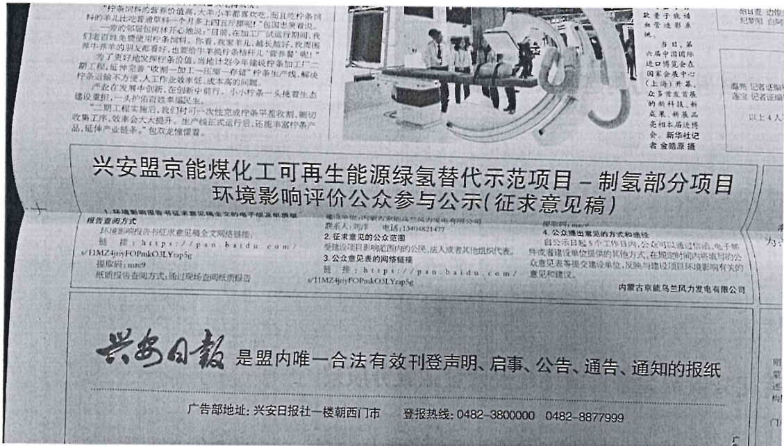
图 2 第一次报纸公示照片