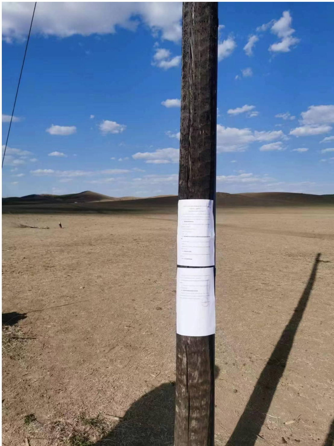
图 2.2-5 (1) 张贴公告