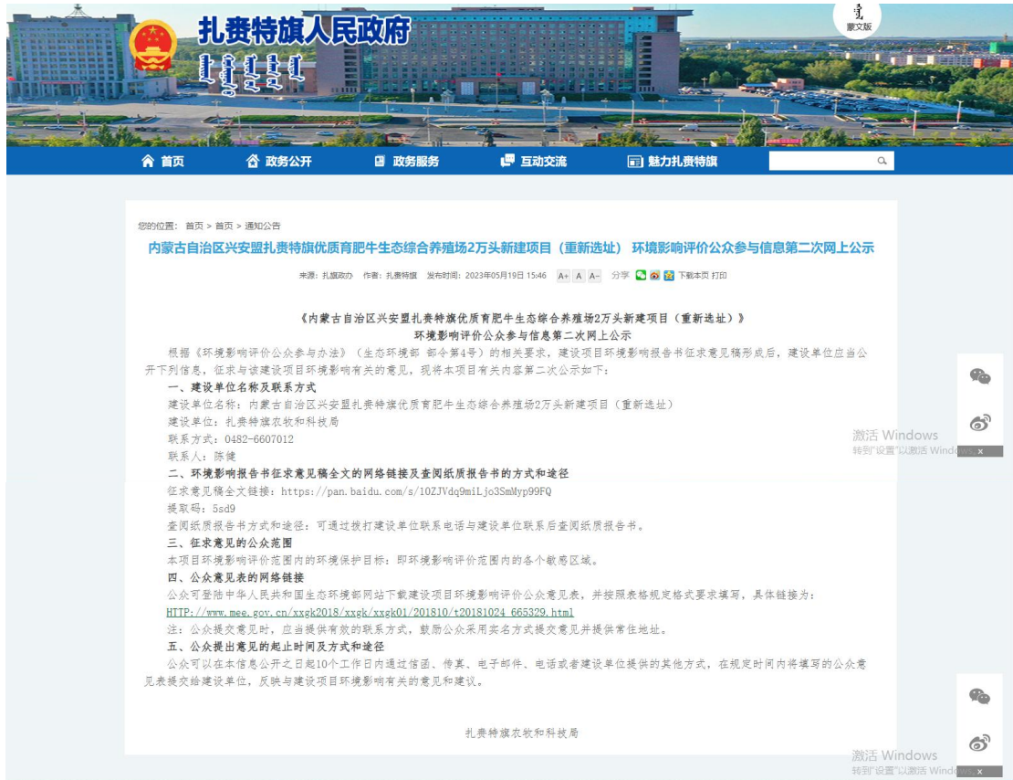
图 2.2-2 环境影响报告书征求意见稿网站公示截图