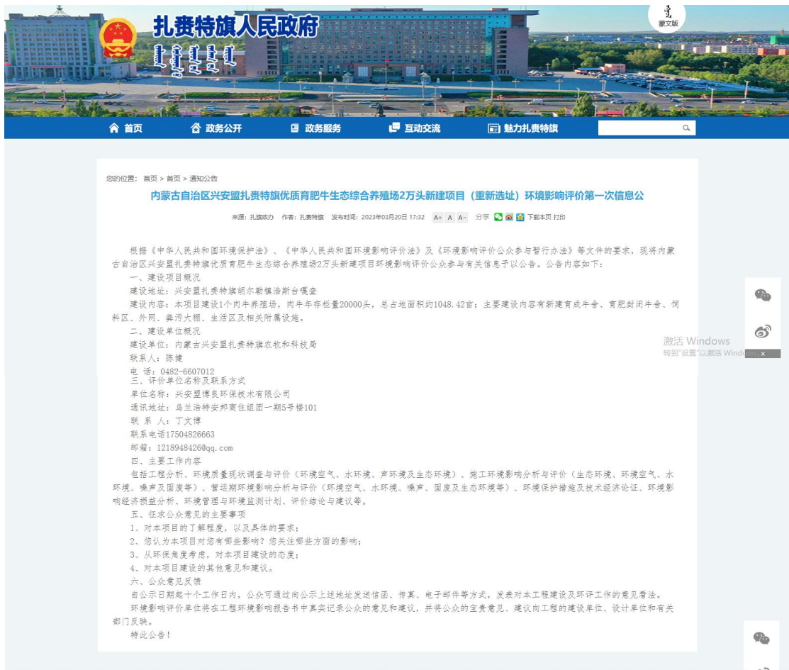
图 2.2-1 第一次网络公示截图