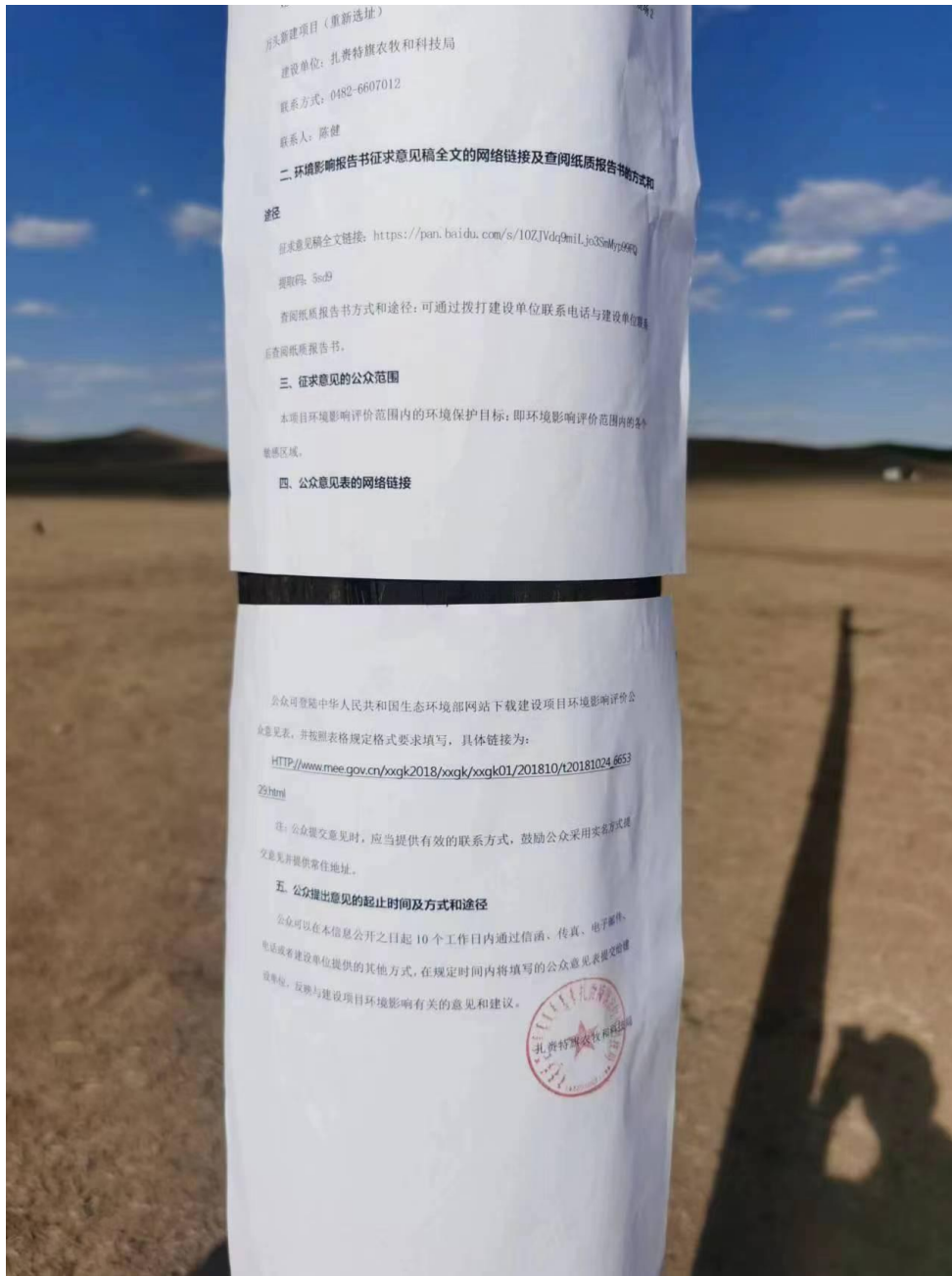
图 2.2-5 (2) 张贴公告