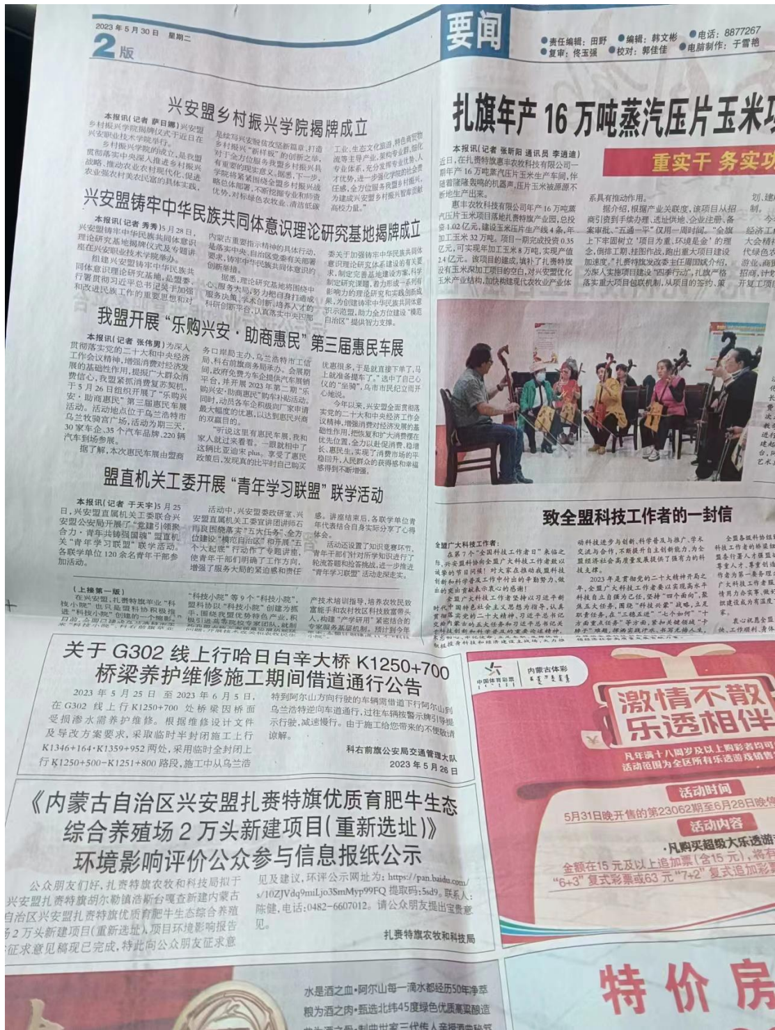
图 2.2-4 (1) 报纸第二次公示 (《兴安日报》5.30)