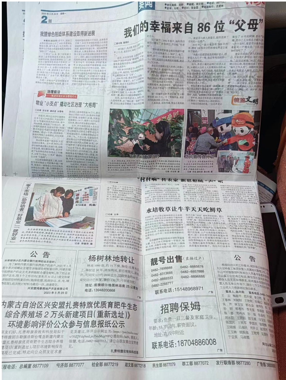
图 2.2-3 (1) 报纸第一次公示 (《兴安日报》5.29)