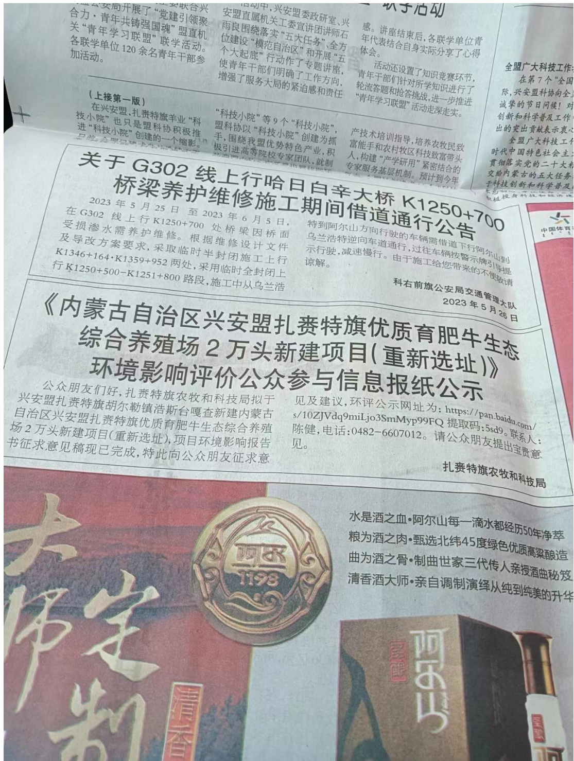
图 2.2-4 (2) 报纸第二次公示 (《兴安日报》5.30)