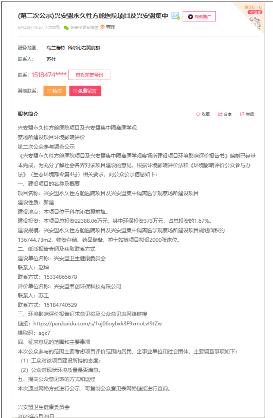
图 3-1 征求意见稿网络公示