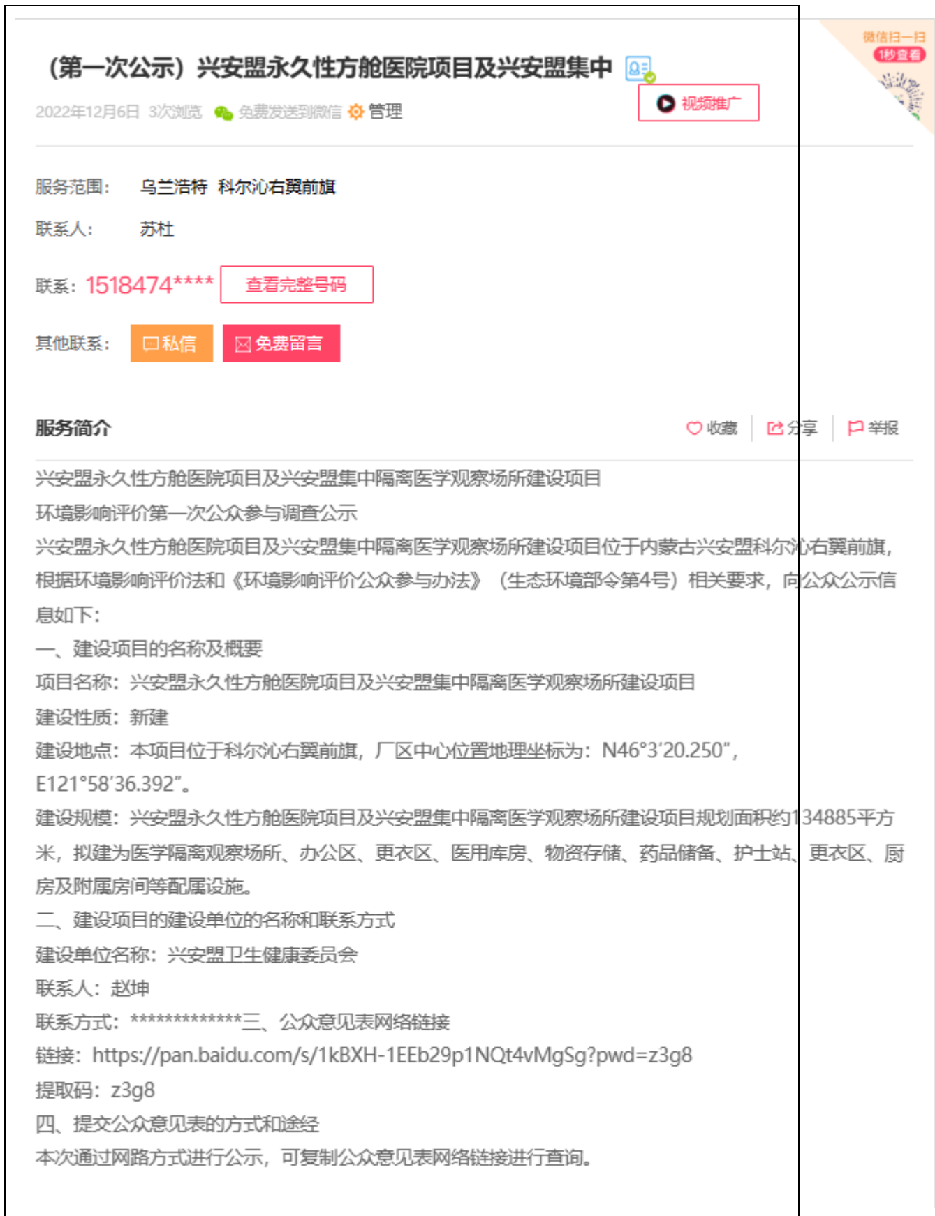
图 2-1 征求意见稿网络公示截图