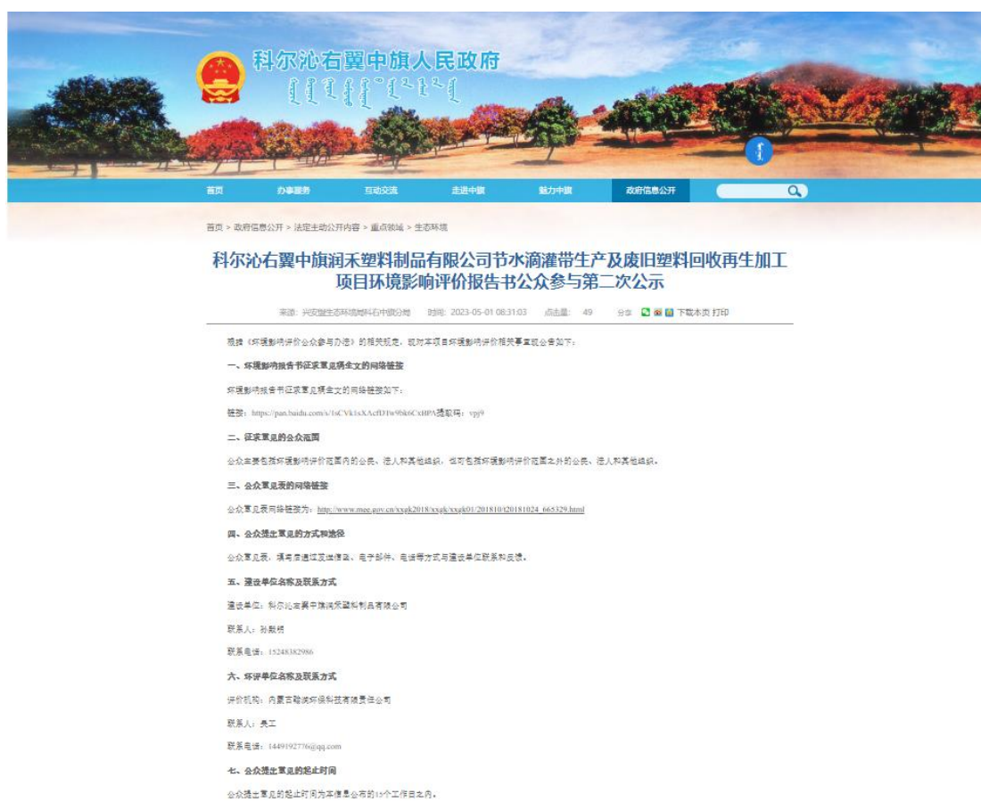
图 3.2-1 二次公示截图

我公司在环境影响报告书基本完成后，在报送环境保护行政主管部门审批前，建设单位于2023年05月01日至2023年05月23日，通过网络平台（科尔沁右翼旗中旗人民政府官网： http://www.kyzq.gov.cn/kyzq/zfxxgk27/fdzdgknr7/zdly29/sthj7/5550623/index.html ），公开二次公示信息。公示截图见图3.2-1。