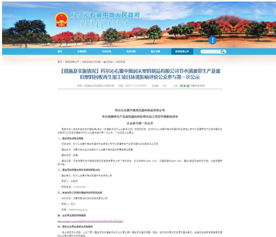
图 2.1-1 一次公示截图