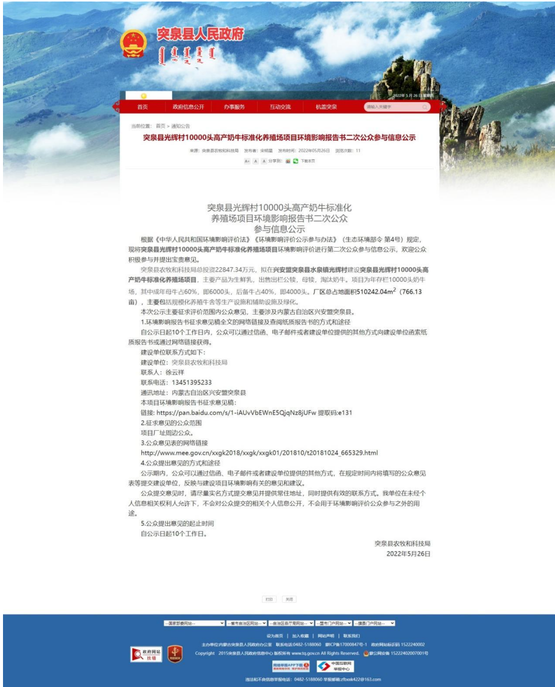
图 3-1 二次网络平台公示