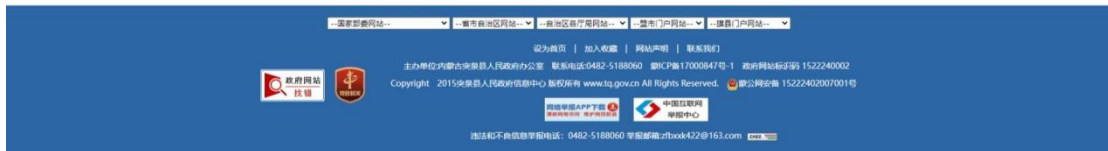
2-1 首次网络公示截图