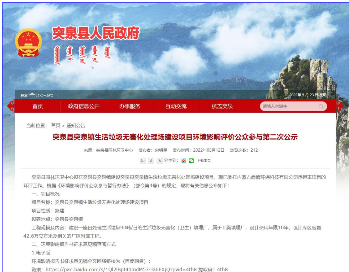
图2 第二次网络公示

我单位于2022年5月12日在突泉县人民政府网发布了《<突泉县突泉镇生活垃圾无害化处理场建设项目>环境影响评价公众参与公示》，网址为： http://www.tq.gov.cn/ ；在公示期间，建设单位未收到任何群众来电、来信、来访等形式的有关项目环境影响报告书的意见。