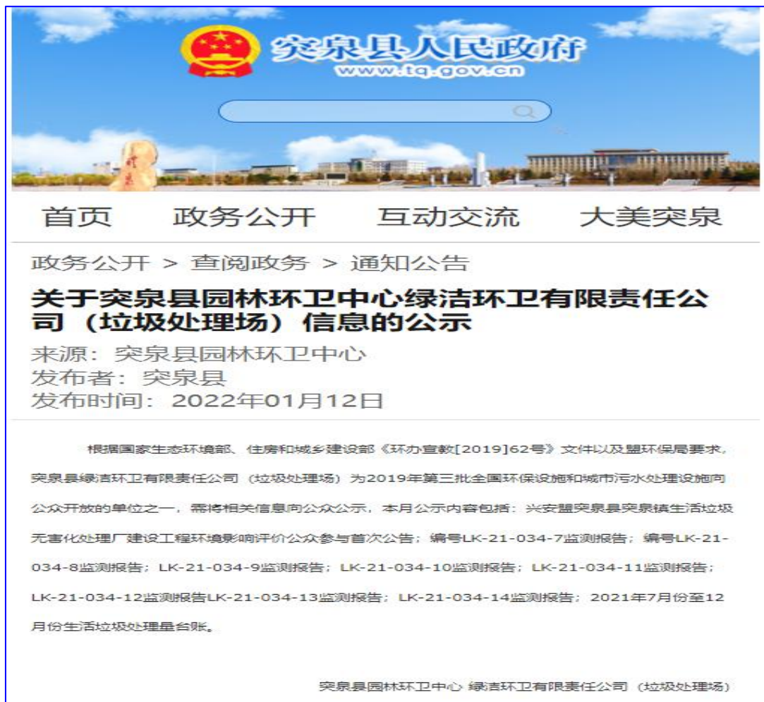
图1 第一次网络公示

根据《环境影响评价公众参与暂行办法》（环发[2006]28号文），我单位于2022年1月12日在突泉县人民政府网发布了《<突泉县突泉镇生活垃圾无害化处理场建设项目环境影响报告书>环境影响评价公众参与第一次公示》，网址为： http://www.tq.gov.cn/ 在公示期间，建设单位未收到任何群众来电、来信、来访等形式的有关项目环境影响报告书的意见。