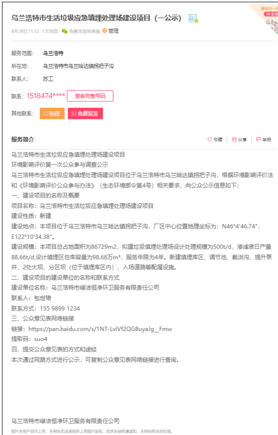
图 2-1 征求意见稿网络公示截图