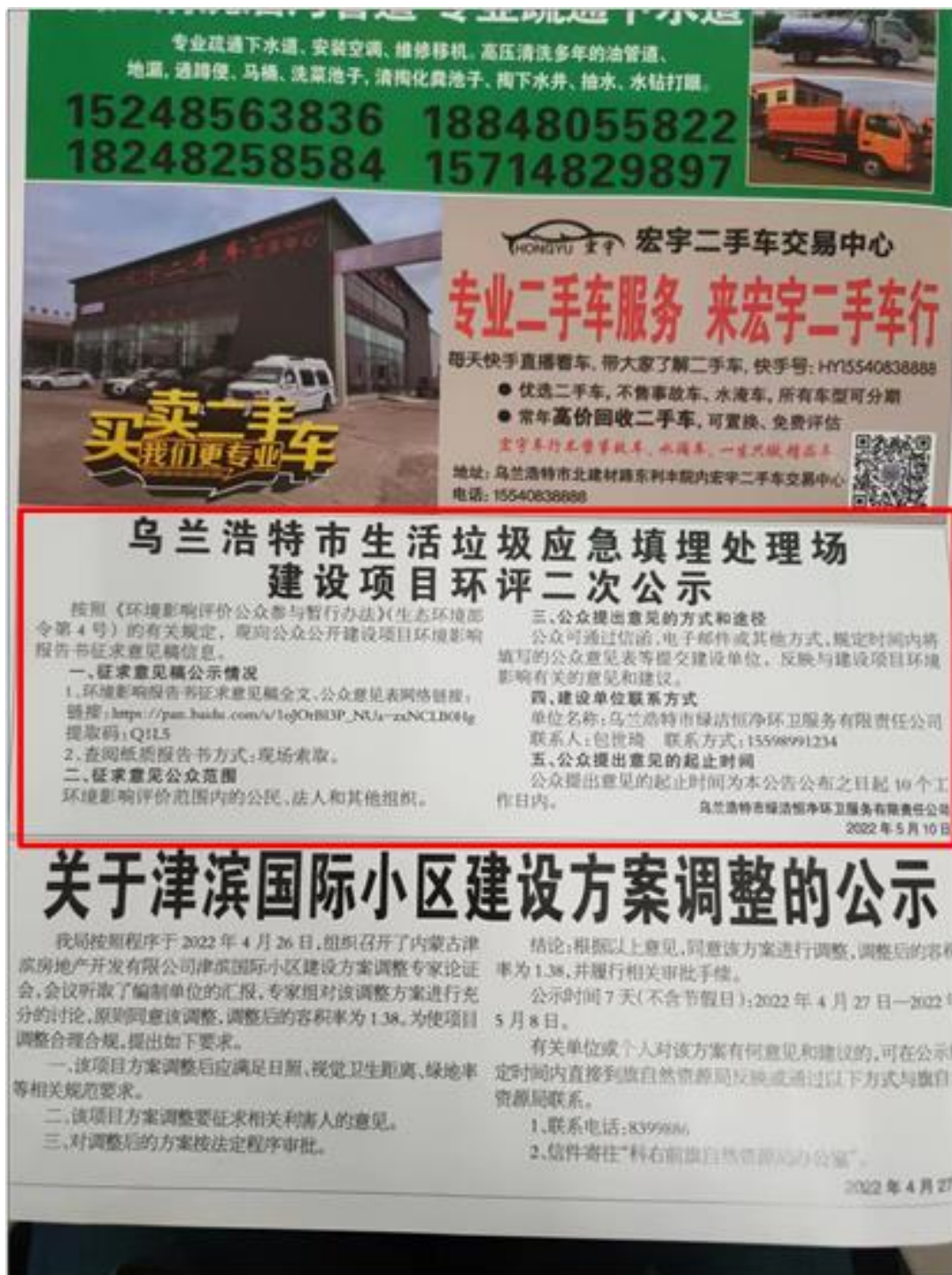
图 3-2 征求意见稿第一次报