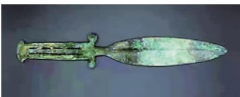
◆出土的特殊形制青铜短剑。