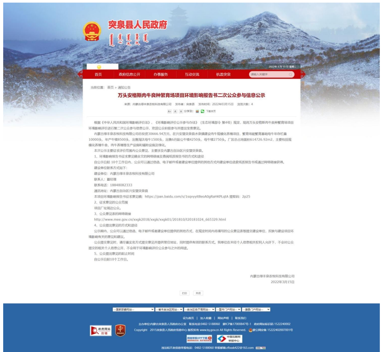
图 3-1 二次网络平台公示

（ http://www.tq.gov.cn/tq/index/tzgg12/4986011/index.html ）进行了公示。公示截图见图3-1。