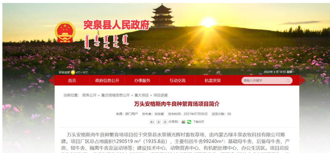
2-1 首次网络公示截图

万头安格斯肉牛良种繁育场项目首次环境影响评价信息公开由建设单位于2021年7月6日在突泉县人民政府网（ http://www.tq.gov.cn/tq/zwgk25/zdlyxxgk55/zdxm/xmjz22/4326067/index.htm ）进行了公示。公示截图见图 2-1。