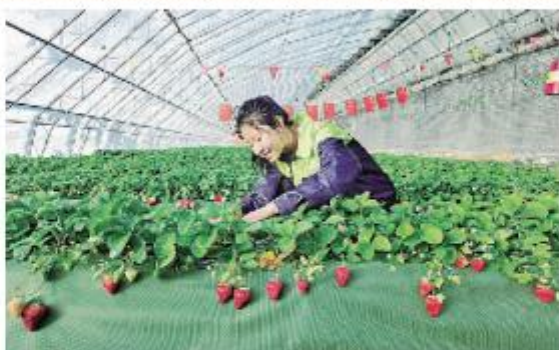
◆设施农业促增收。